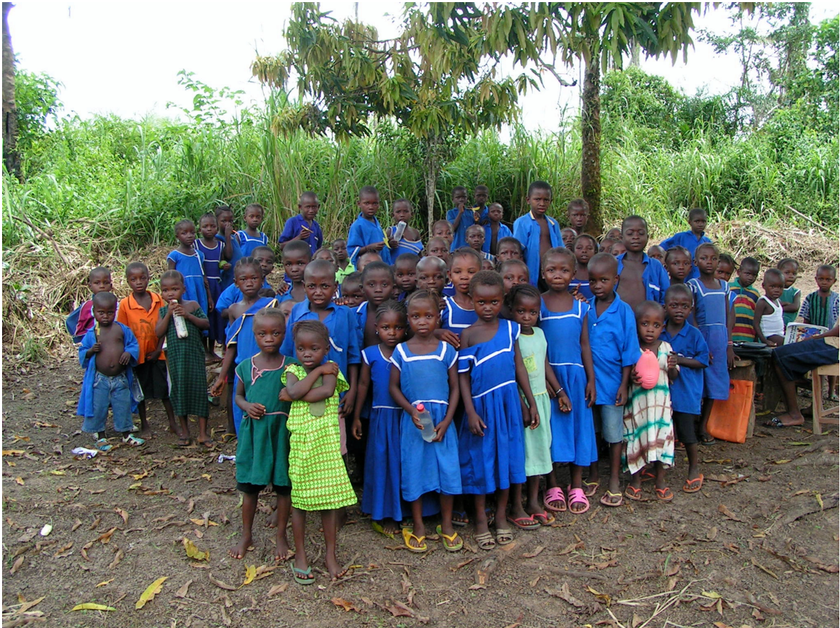
School in het veld, door de warmte onder de boom